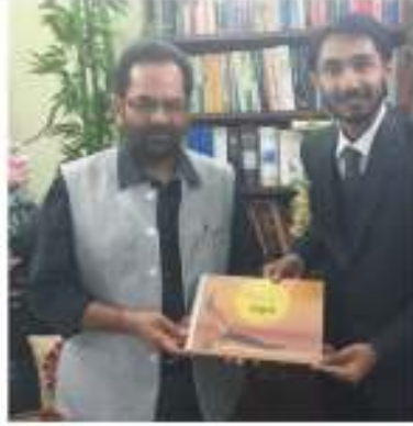
मा. श्री. मुख्तार अब्बास नकवीजी केन्द्रीय अल्पसंख्यांक मंत्री