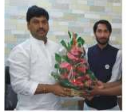
मा. श्री. धनंजय मुंडेजी विरोधी पक्ष नेता (विधान परिषद)