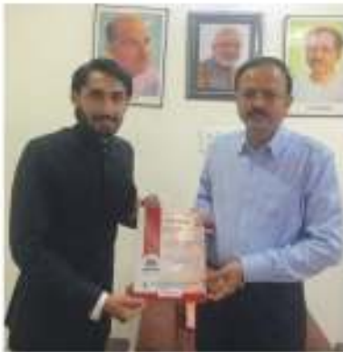
मा. श्री. सुभाष भामरेजी रक्षा राज्यमंत्री भारत सरकार