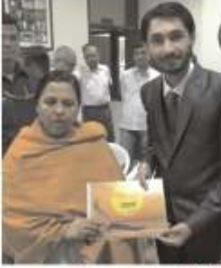
मा. सु.श्री. उमा भारतीजी केन्द्रीय जल संसाधन, नदी विकास और गंगा सफाई मंत्री