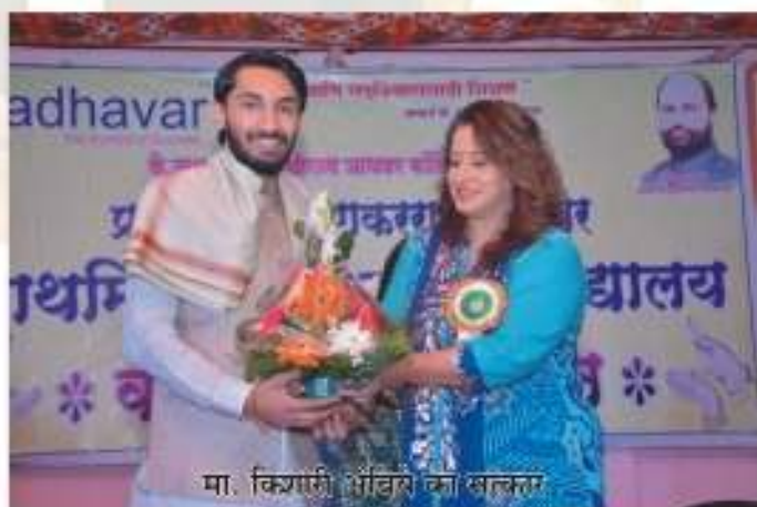
मा. किशोरी भंडार का सत्कार