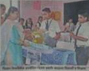
विज्ञान प्रदर्शनीत विद्यार्थी विज्ञान प्रदर्शनीत विद्यार्थी विज्ञान प्रदर्शनीत विद्यार्थी