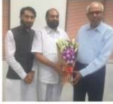
पद्म विभूषण मा. श्री. रघुनाथ माशेलकरजी