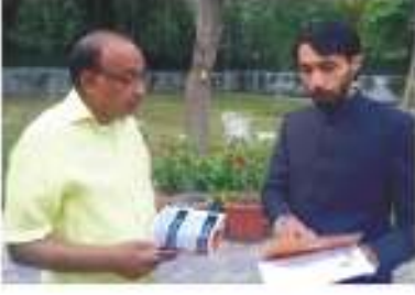
मा. श्री. विजय गोयलजी खेलमंत्री, भारत सरकार