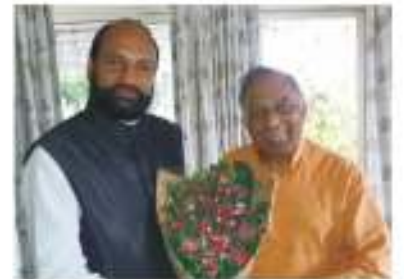
पद्मश्री एवं पद्मभूषण मा. श्री. विजय भटकरजी