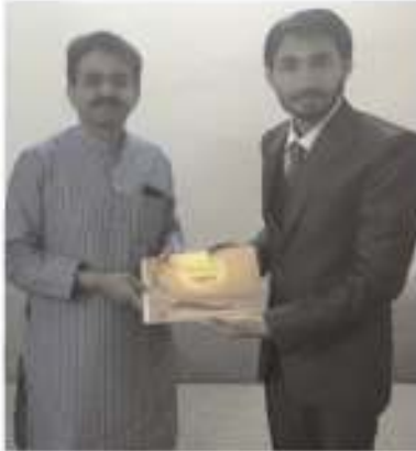
मा. श्री. राजीव सातवजी सांसद एवं राष्ट्रीय युवा कांग्रेस के भूतपूर्व अध्यक्ष