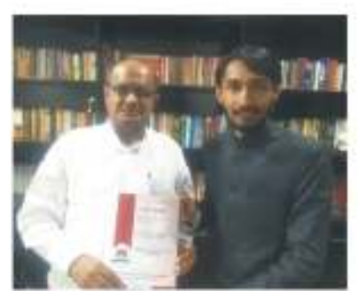
मा. श्री. के. सी त्यागीजी सांसद राज्यसभा अध्यक्ष - उद्योग संबंधी स्थाई समिती