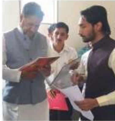
मा. श्री. पृथ्वीराज चव्हाणजी महाराष्ट्र राज्य के भूतपूर्व मुख्यमंत्री