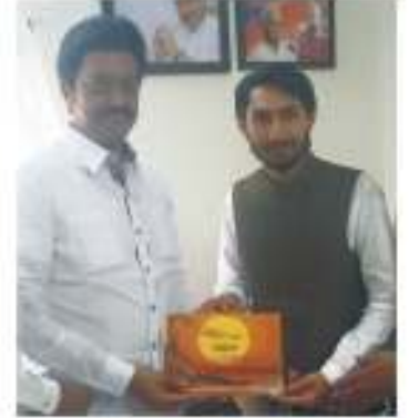
मा. श्री. अनिल शिरोळेजी सांसद, लोकसभा