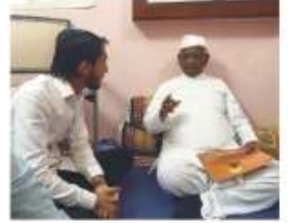
पदमभूषित मा. श्री. अण्णा हजारेजी