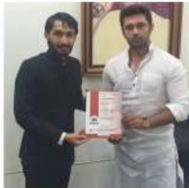
मा. श्री. चिराग पासवानजी सांसद (लोकसभा)